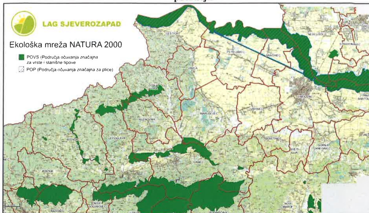
Slika 3: Ekološka mreža Natura 2000 na području LAG-a