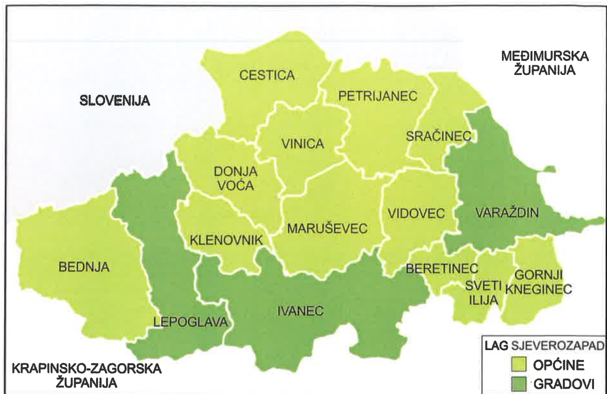
Slika 1. Karta LAG područja s vidljivim granicama JLS-ova u LAG-u